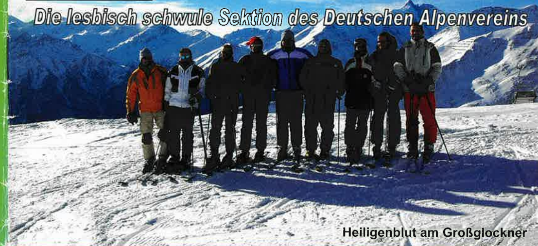
Heiligenblut am Großglockner

Die lesbisch schwule Sektion des Deutschen Alpenvereins